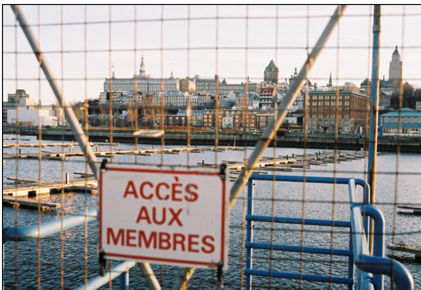
À Québec, le fleuve reste inaccessible.

La période de 1800 à 1970. – Au cours du 19 e siècle, la Révolution industrielle ajoutée à la désuétude progressive des lois françaises entraîne un blocage graduel mais complet des accès publics au fleuve par les corporations maritimes et portuaires. La population s'en offusque, la municipalité tente de maintenir des accès publics: sans succès. Pétitions et suppliques des magistrats du quartier Saint-Roch auprès du Gouverneur colonial connaissent le même sort. Vers le milieu du 19 e siècle, à une exception près semble-t-il (l'escalier du marché Finlay), le rivage est bloqué pour tout le monde hormis les intérêts portuaires et maritimes. Cette situation dure encore aujourd'hui comme dans bien des villes analogues à Québec (Bordeaux, Montréal, Trois-Rivières...). David-Thierry Ruddel, historien, a étudié tout cela dans sa thèse géniale et méconnue: «Québec, 1765-1832 – L'évolution d'une ville coloniale» ( www.gensdebaignade.org/DavidThierryRUDEL.pdf ).